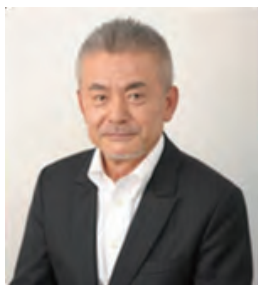
桂経営ソリューションズ(株) 代表取締役

1年間を通じて学ぶ“発想の転換”と“経営スキルの底上げ”を図るための勉強会です。